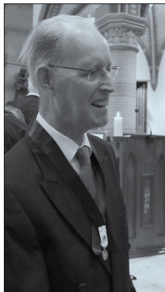
IJs Bruin krijgt onderscheiding St. Gregorius voor 50 jaar koorzang.